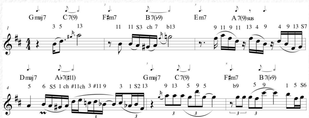
Figura 1: Análise melódica do Improvise de Rua Genebra (Nivaldo Ornelas), de c. 1 a c. 6, feita pelo autor.

Nos departamentos dedicados ao ensino do jazz nas universidades norte americanas, faz parte da grade curricular a transcrição semanal de um improviso de um grande expoente deste gênero. Uma vez feita a transcrição, o aluno pode fazer a análise melódica, classificando cada nota em relação às cifras alfa numéricas para aferir a função destas notas em relação ao acorde em curso. A nomenclatura da análise melódica na metodologia berkleana 6 é feita da seguinte forma: notas pertencentes ao acordes são denominadas 1,3,5, e 7; tensões são escritas como T9, T11, T#11, Tb13 etc, e notas de aproximação (passagem) recebem a sigla S2 ( scale 2 , por exemplo) ou, se for uma passagem cromática recebe “ch”, como vemos na Figura 1.