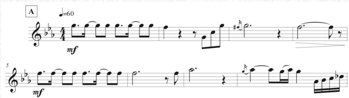
Figura 3: Escrita da melodia da melodia de Minas Geraes, quantizada para 4/4 e editorada após transcrição.

Pode-se observar que o padrão rítmico repetido escolhido foi necessário para dar o fluxo necessário para enquadrar a melodia no compasso regular 4/4.