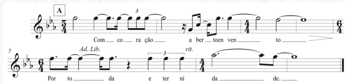
Figura 2: Transcrição descritiva literal da interpretação em Milton Nascimento na música Minas Geraes

Com a necessidade de enquadrar este canto em 4/4, para realizar uma encomenda de arranjo para orquestra, é preciso quantizar 9 a escrita de forma a possibilitar sua execução por 25 músicos. Chamamos este processo de transcrição funcional, onde a ferramenta transcrição é fundamental no processo de extração da melodia para criar um documento inicial confiável modificando-o em seguida (arranjo) para viabilizar assim sua execução com grupos maiores. Na figura 2 vemos a transcrição mais aproximada possível da interpretação de Milton Nascimento, visto que o pulso é flutuante e sua interpretação é repleta de rubatos . A alternância de compassos, quáteras, e indicações de Ad. Lib são recursos necessários para buscar a representação gráfica aproximada da interpretação de Milton e os pontos de repouso melódico.