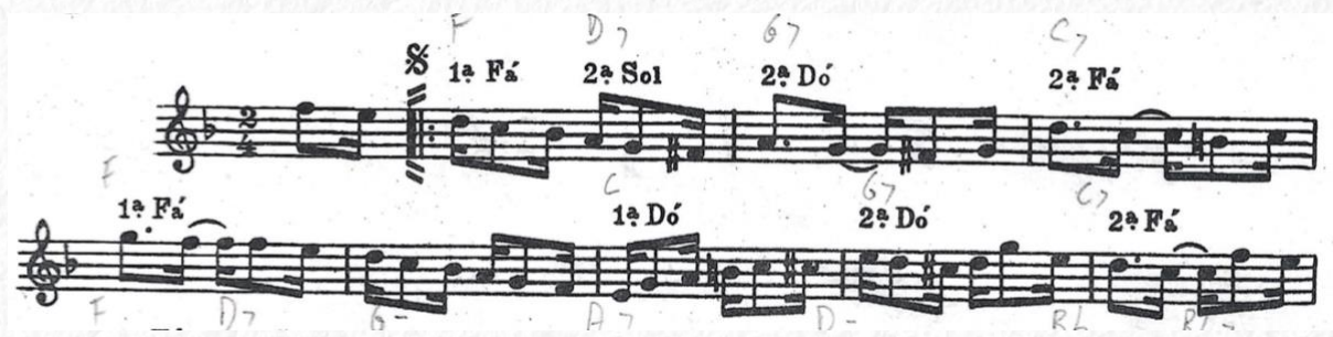
Figura 4: Proêsas de Solon.

Em outros gêneros como o choro a interpretação do solista inclui códigos não escritos como antecipação rítmica, ornamentação, flexibilidade (agógica) e variações melódicas. Estes procedimentos são necessários na música popular para se obter na execução o que chamamos no Brasil de balanço ( swing ) ou bossa. Na figura 4, pode-se ver o início do choro Proêsas de Solon (Pixinguinha & Benedito Lacerda) na partitura editada em 1947 e na figura 5 vemos a transcrição dos primeiros 8 compassos da interpretação de Benedito Lacerda da gravação de 1946 da mesma música em duo com Pixinguinha, transcrita por este autor e Mário Sève, editada em 2010, onde podemos observar as antecipações e os acréscimos feitos pelo flautista: